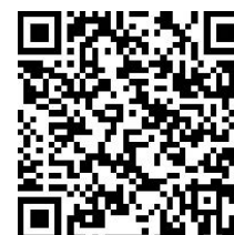
Formulaire d'adhésion réduction Pass'Sport