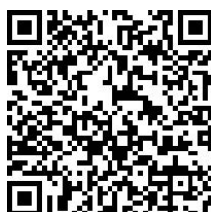
Formulaire d'adhésion adhérent COU